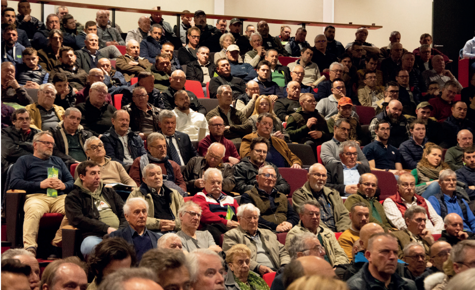
450 personnes ont assisté à l'Assemblée générale. Parmi elles, de nombreuses personnalités politiques de tous bords, venues assurer de leur soutien auprès du monde de la chasse.

Le 1 er avril, les adhérents de la Fédération des chasseurs de l'Oise se sont réunis pour leur Assemblée générale. Le bilan d'activités a pu être dressé pour la saison passée ainsi que les orientations budgétaires pour la prochaine saison.